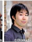
クリスティネ・フィダー(ピアノ)