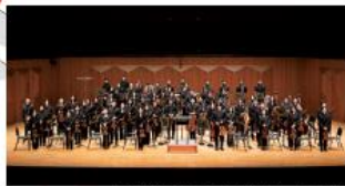
ハンギョン・アルテ・フィルハーモニック