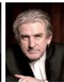
パリー・ダグラス(ピアノ)