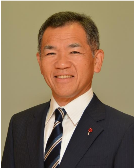
福山市長 枝広 直幹