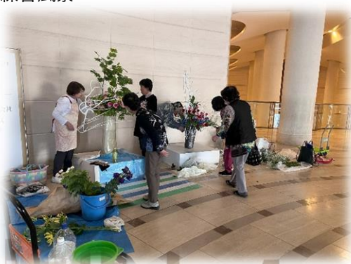
文化連盟華道部による会場装飾