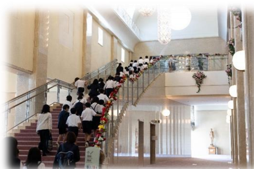
市内小学5年生全員（約4,500人）を招待【全3公演】