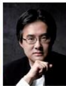
ヨンミン・パーク(指揮)