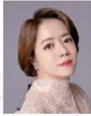
シャロン・キム(ソプラノ)