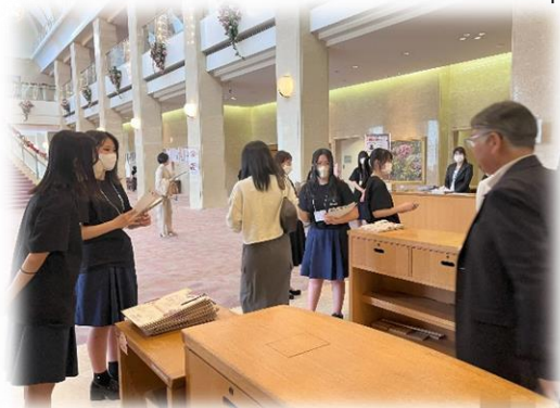
プログラムを配布する市民ボランティア