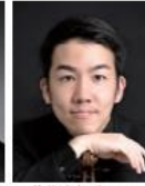
後藤博光(ヴァイオリン)