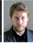
ヤン・イラスキー(ピアノ)