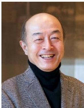
総合プロデューサー (作曲家) 池辺 晋一郎

最後になりますが、この度の能登を襲った災害に、改めまして心からお見舞いを申し上げます。なお、この音楽祭の各会場入り口には、能登他方への復興支援の募金箱をご用意させていただいています。ご協力の程宜しくお願い申し上げます。