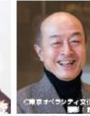
池辺晋一郎(指揮・ナビゲーター)