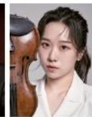
ジュハ・ツェ(ヴァイオリン)