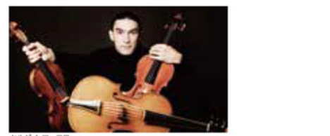
セルゲイ・マーロフ

【出演】セルゲイ・マーロフ(ヴァイオリン&ヴィオロンチェロ・ダ・スパッラ) 【曲目】バッハ「無伴奏チェロ組曲」 バッハ〜イザイ「無伴奏ヴァイオリン・ソナタ」ほか